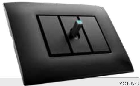
YOUNG INTERRUPTEUR A LEVIER