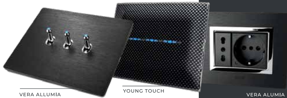
VERA ALLUMIA NEW STYLE