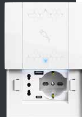
SMART PRISE COULISSANTE