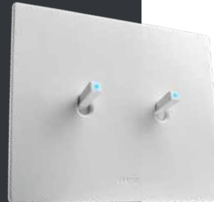
NEW STYLE - CORIAN